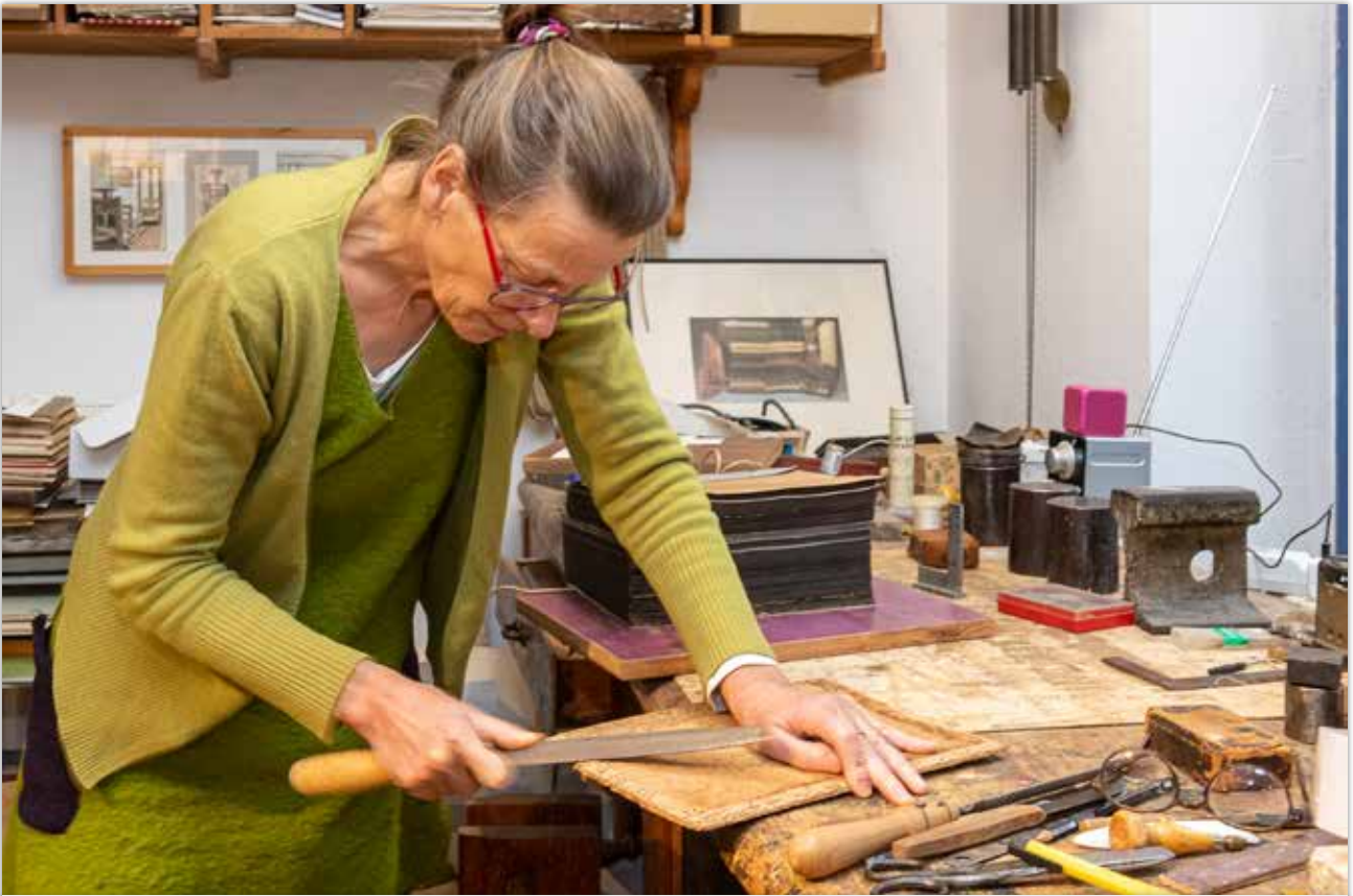
Feilen des neuen (alten) Buchdeckels