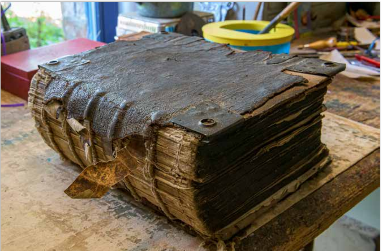
Zustand von Vorderdeckel und Buchrücken vor der Restaurierung