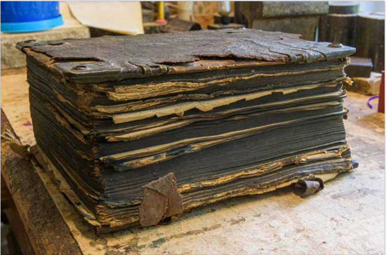
Zustand der Bibel vor der Restaurierung