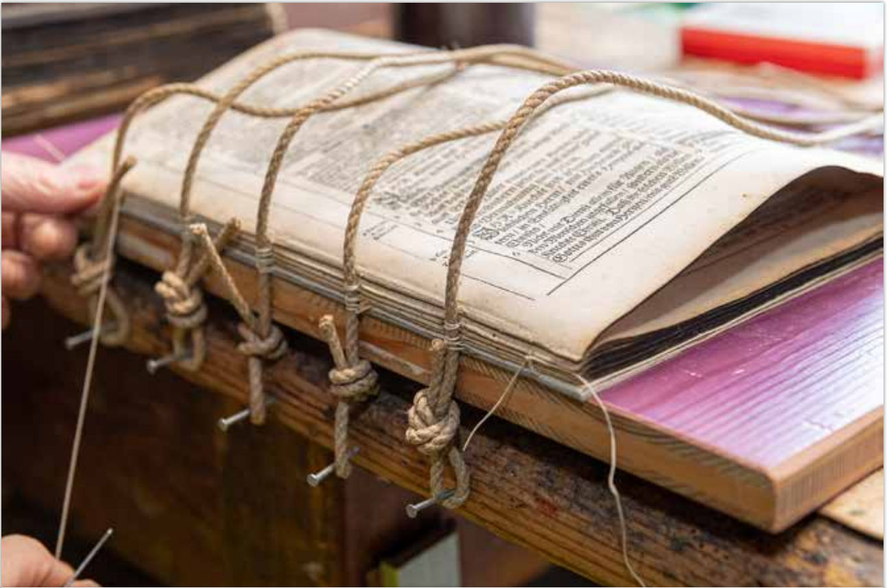
Fixierung der Heftbünde am Tisch