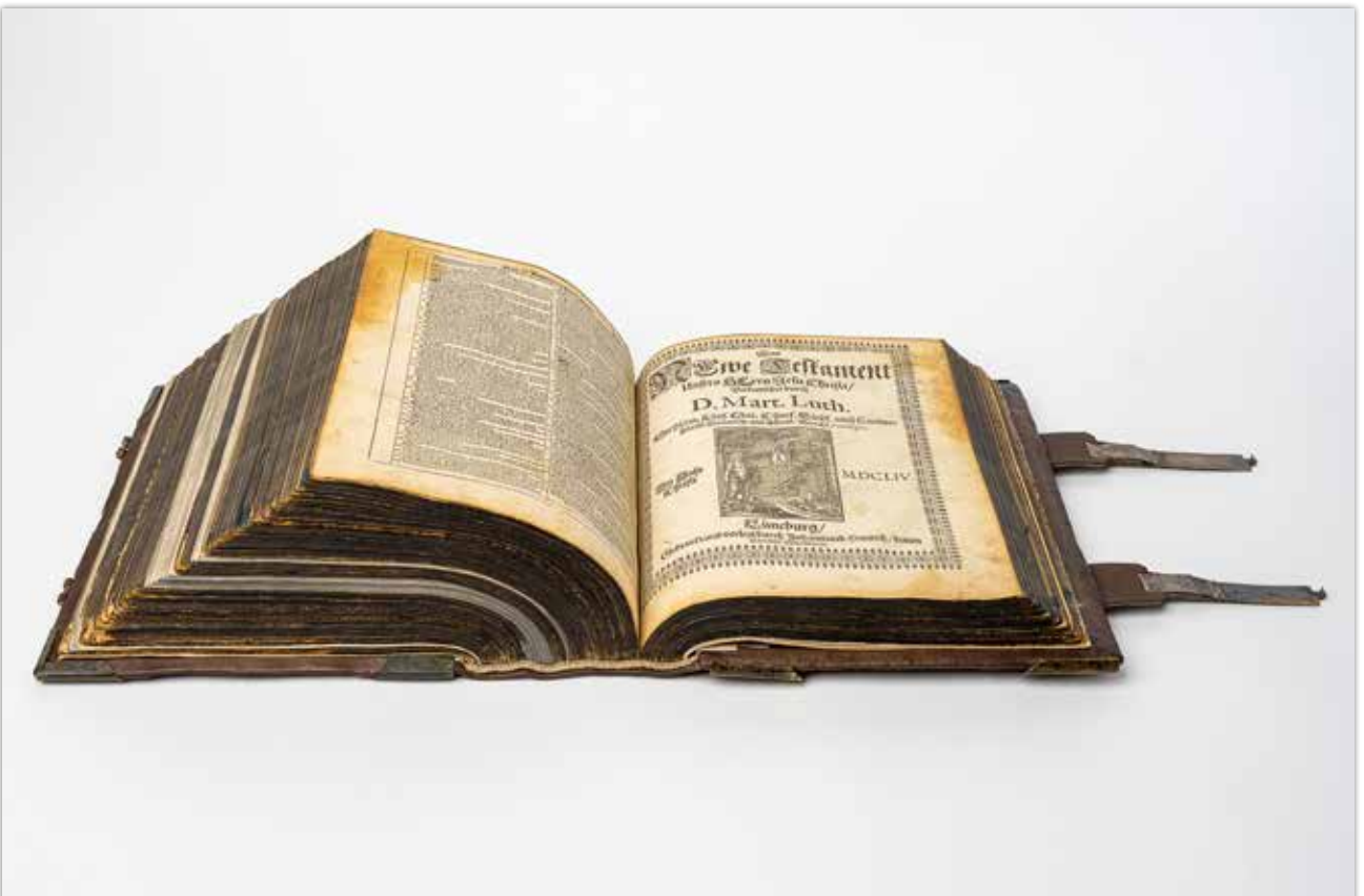
Fertige Bibel mit Schließen