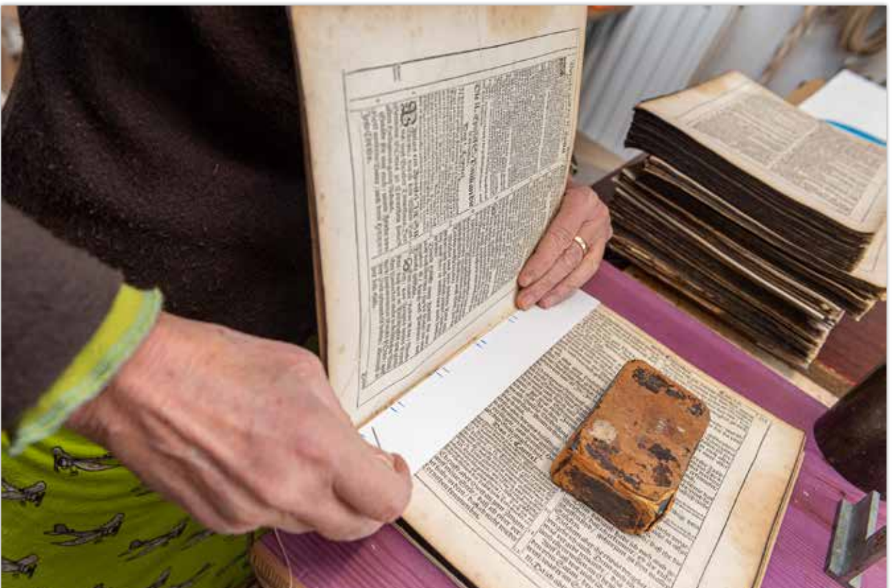
Vorstechen der Lage mit Schablone