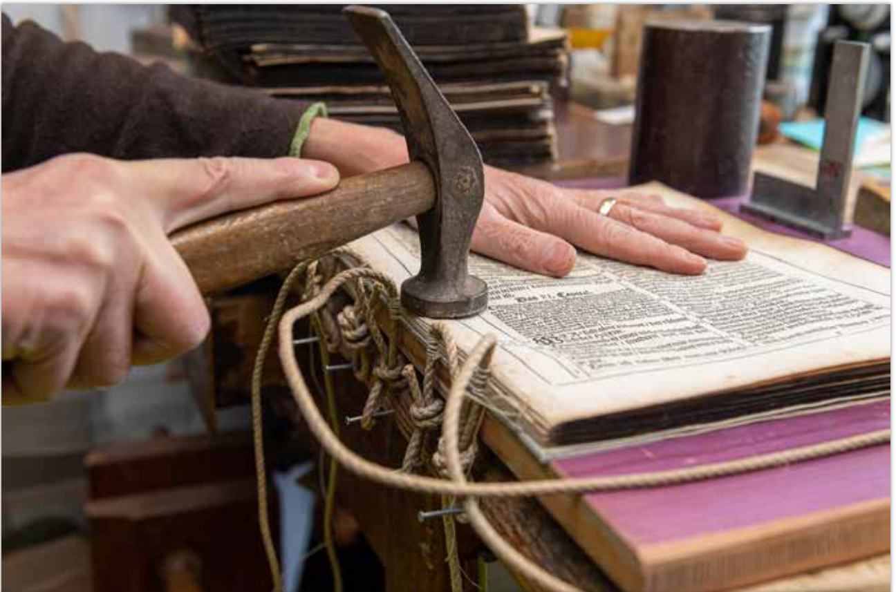
Niederhalten der Lagen beim Heften