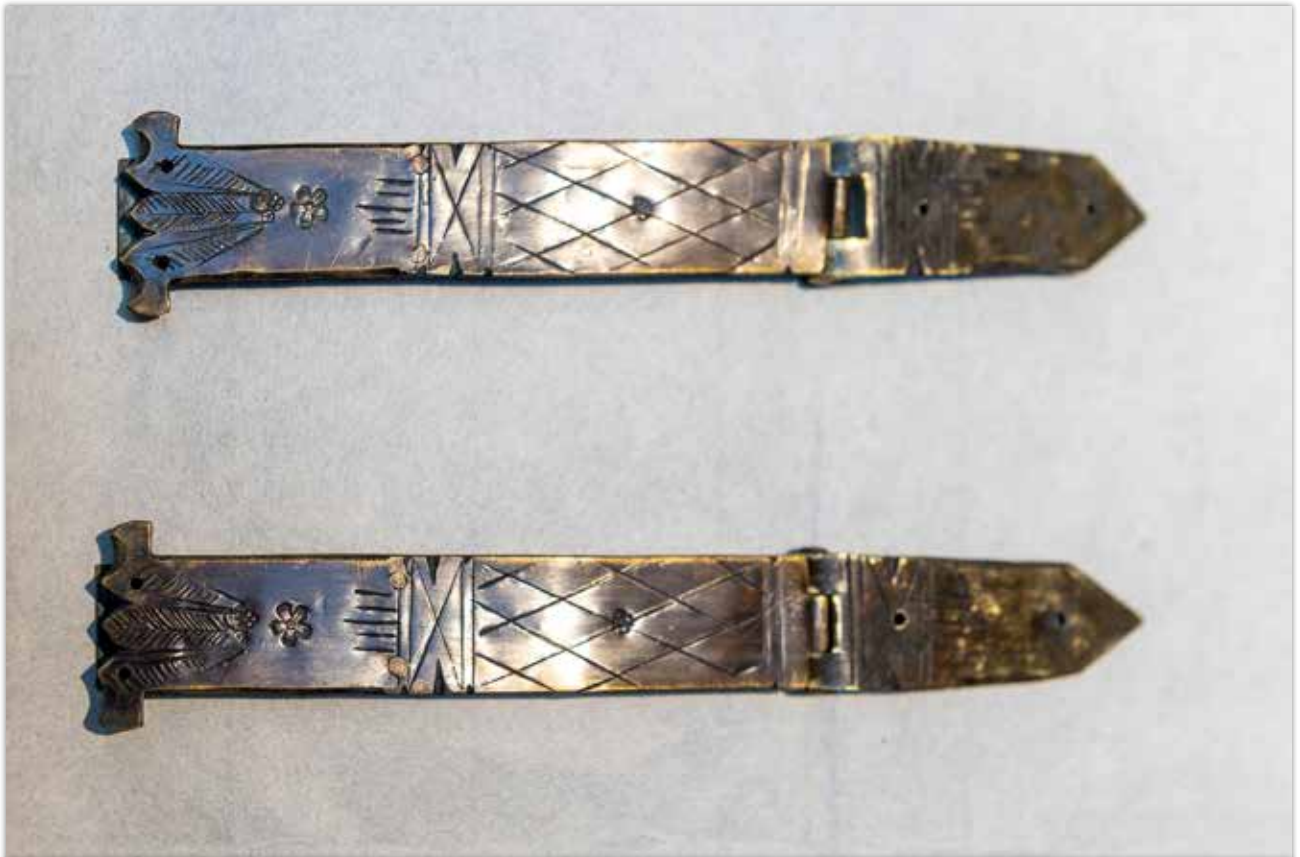
Fehlende Schließen werden neu gearbeitet