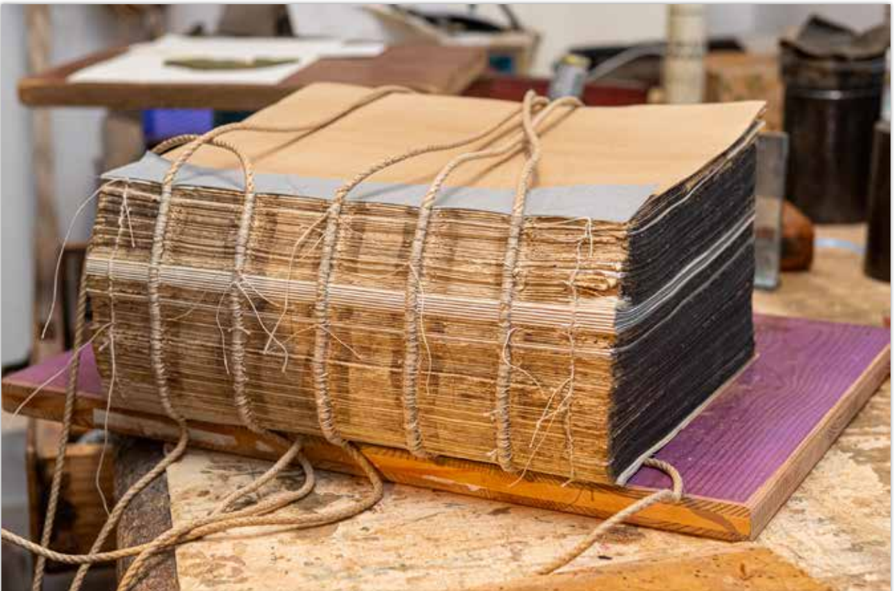
Fertig gehefteter Buchblock