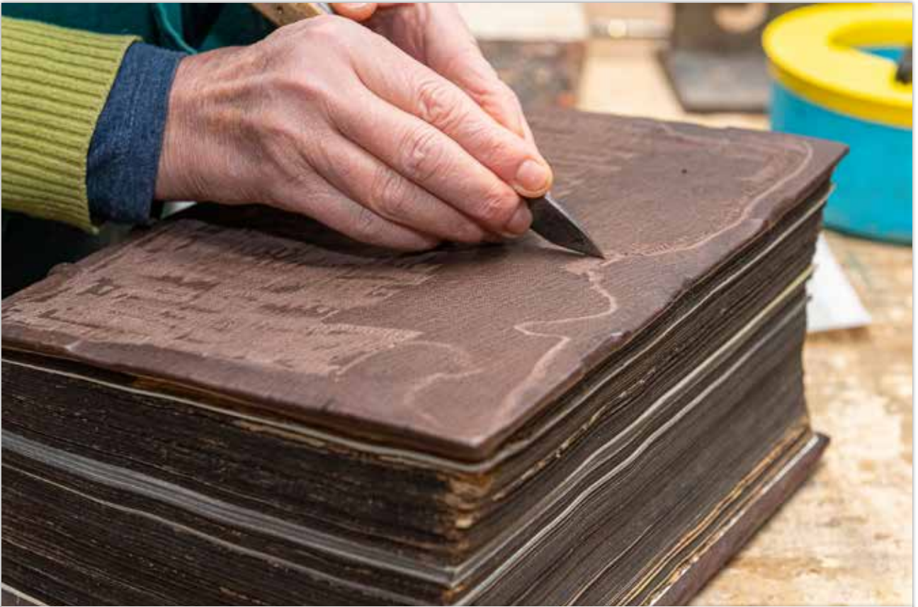
Aufrauhnen des neuen Leders