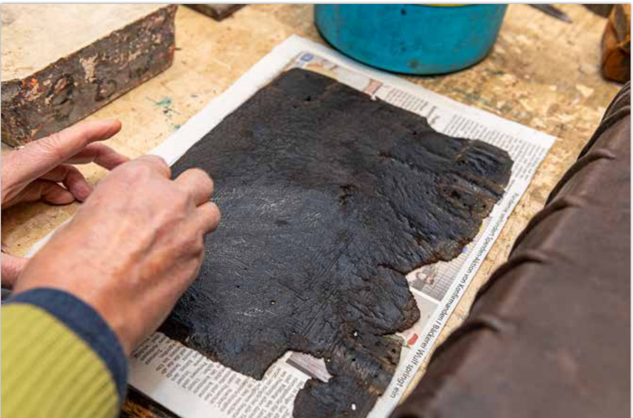
Reinigen des alten Leders