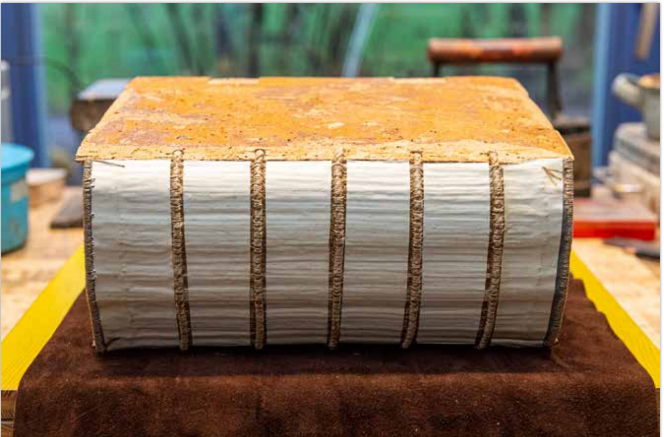
Fertig hinterklebter Buchblock mit Deckeln und Kapitalen