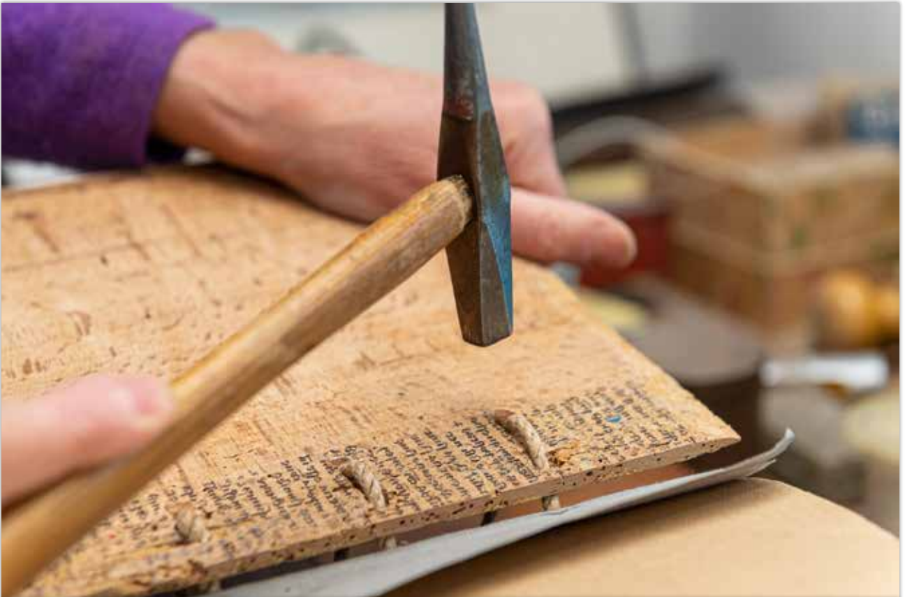
Verpflocken der Bünde im Buchdeckel