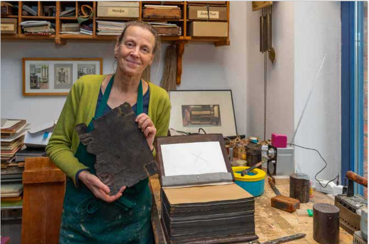
Altes Leder des Vorderdeckels