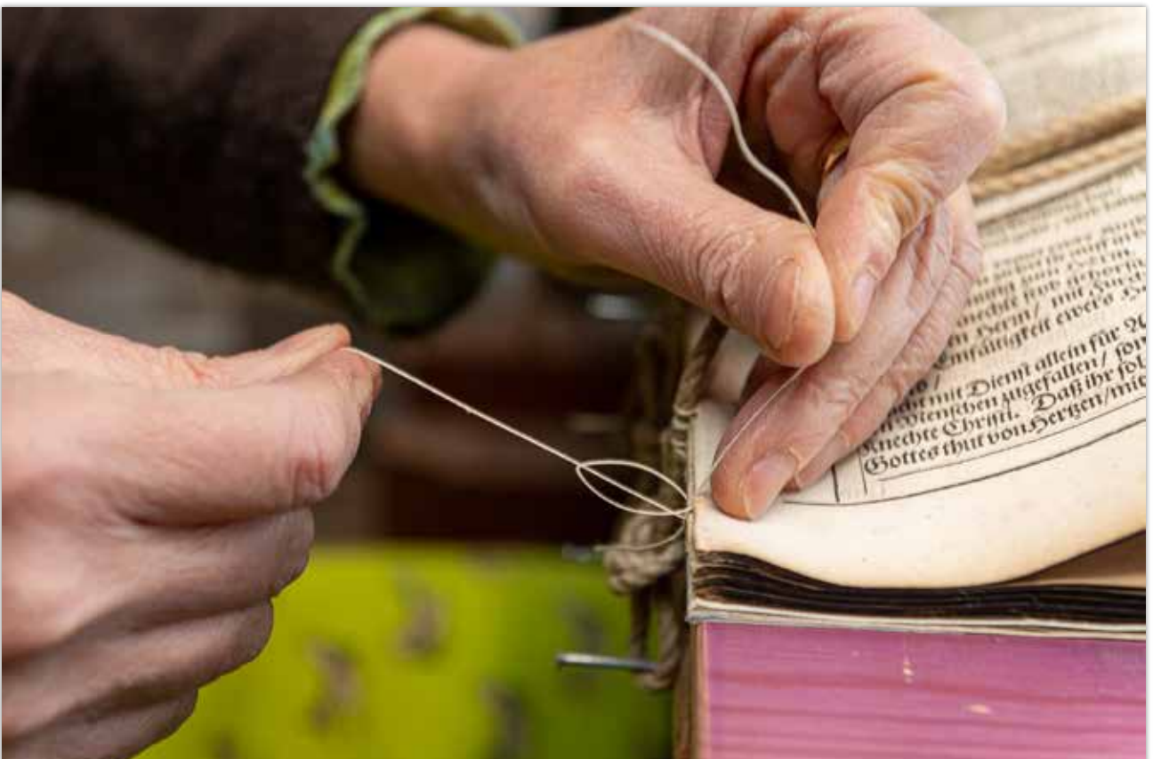
Verfitzen am Ende der Lage