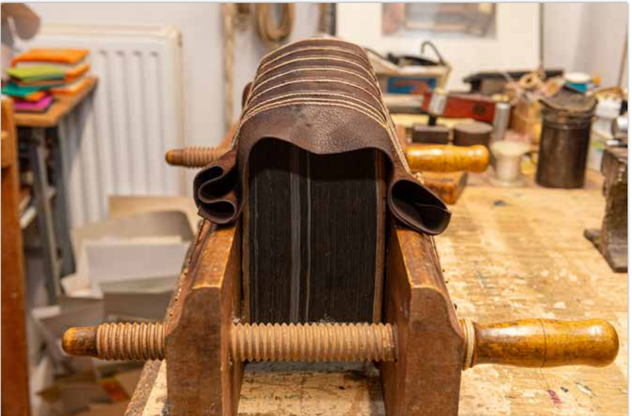
Abbinden des Buchrückens in der Klotzpresse