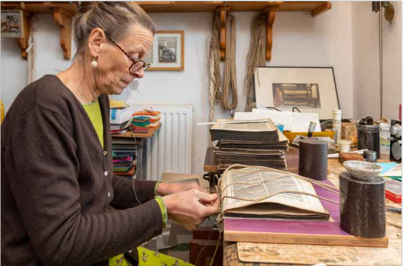
Beginn der zehnstündigen Heftarbeit