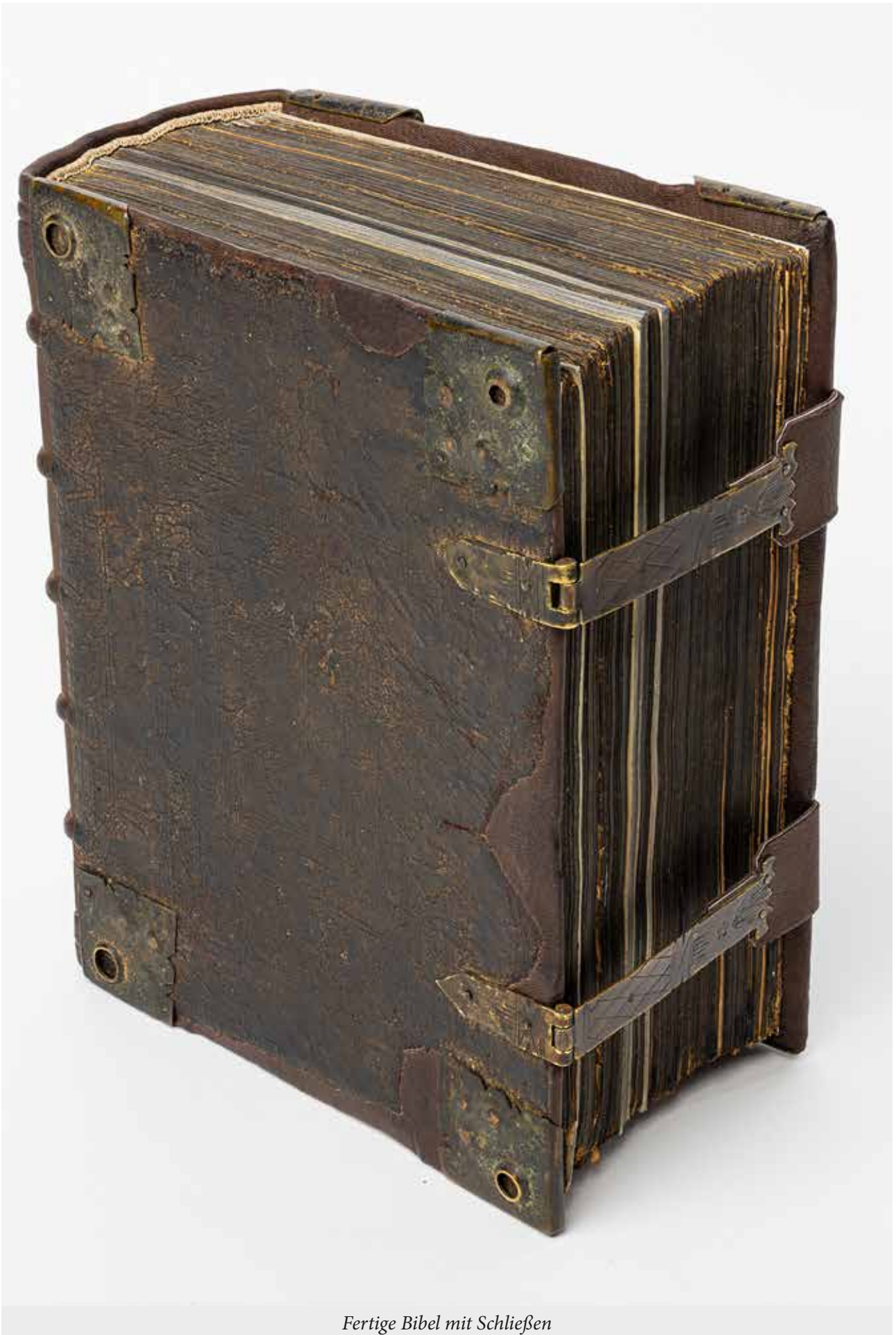
Fertige Bibel mit Schließen