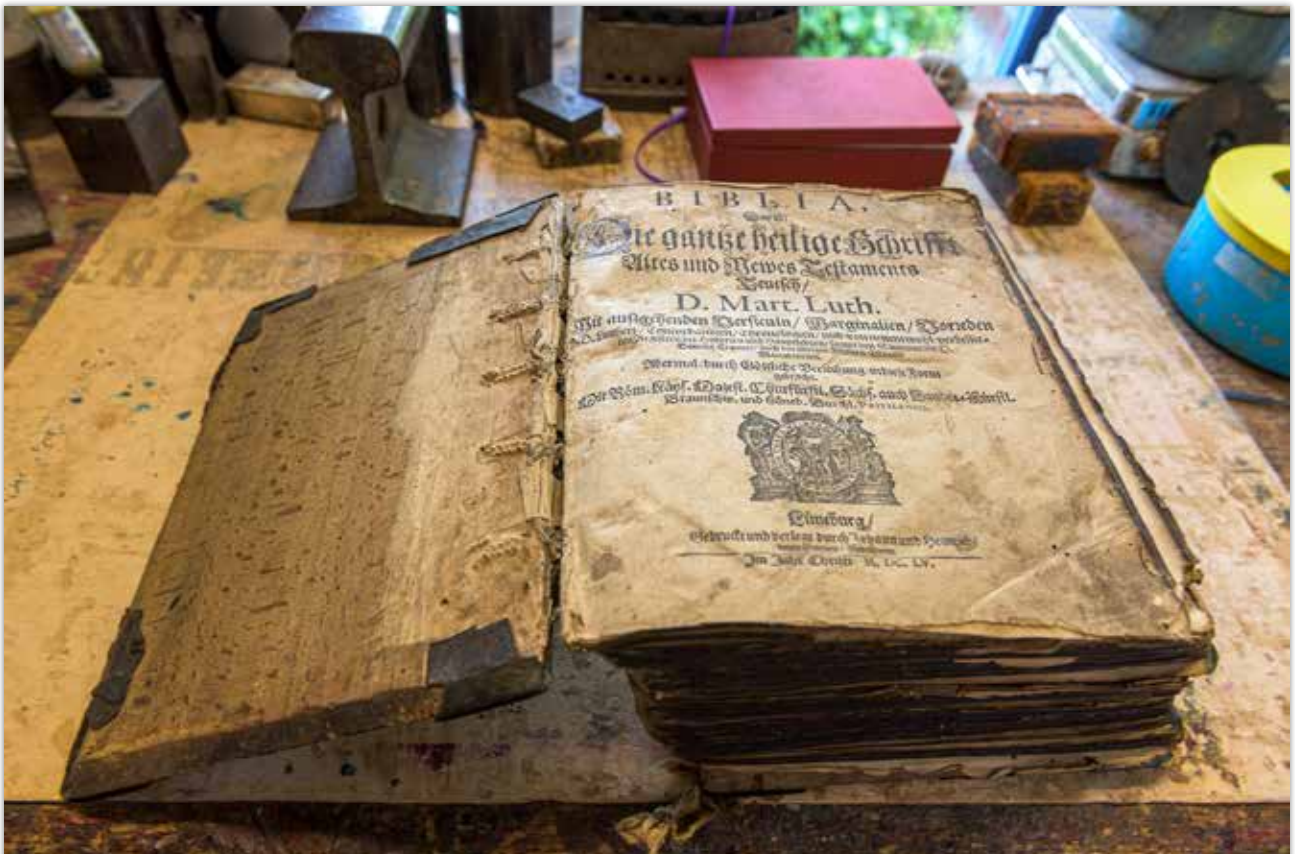
Buchtitel und Deckel vor der Restaurierung