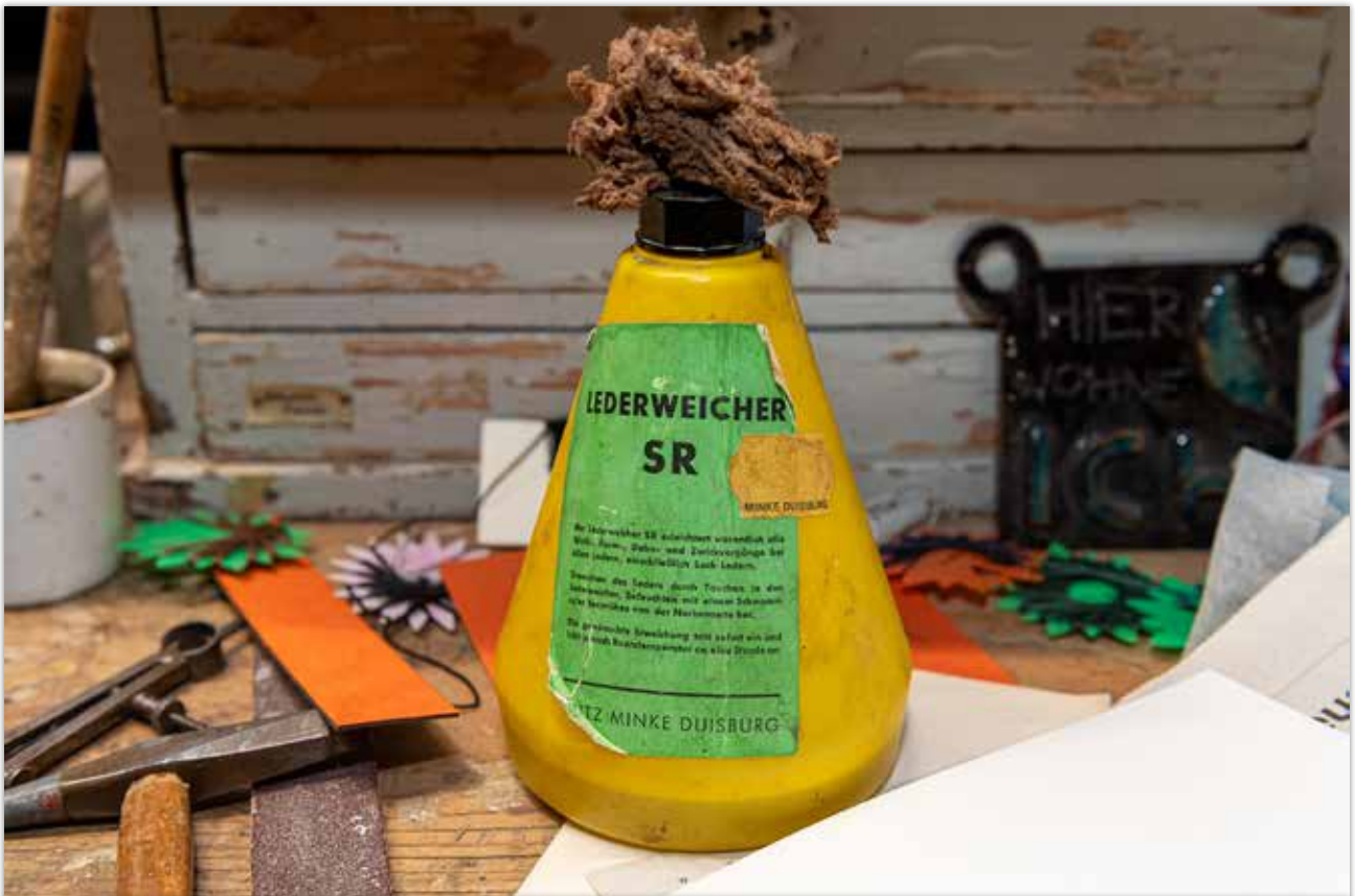
Weichen des alten Leders, damit es nicht bricht