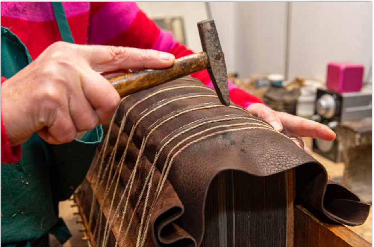
Einarbeiten der Kordel in das Rückenleder