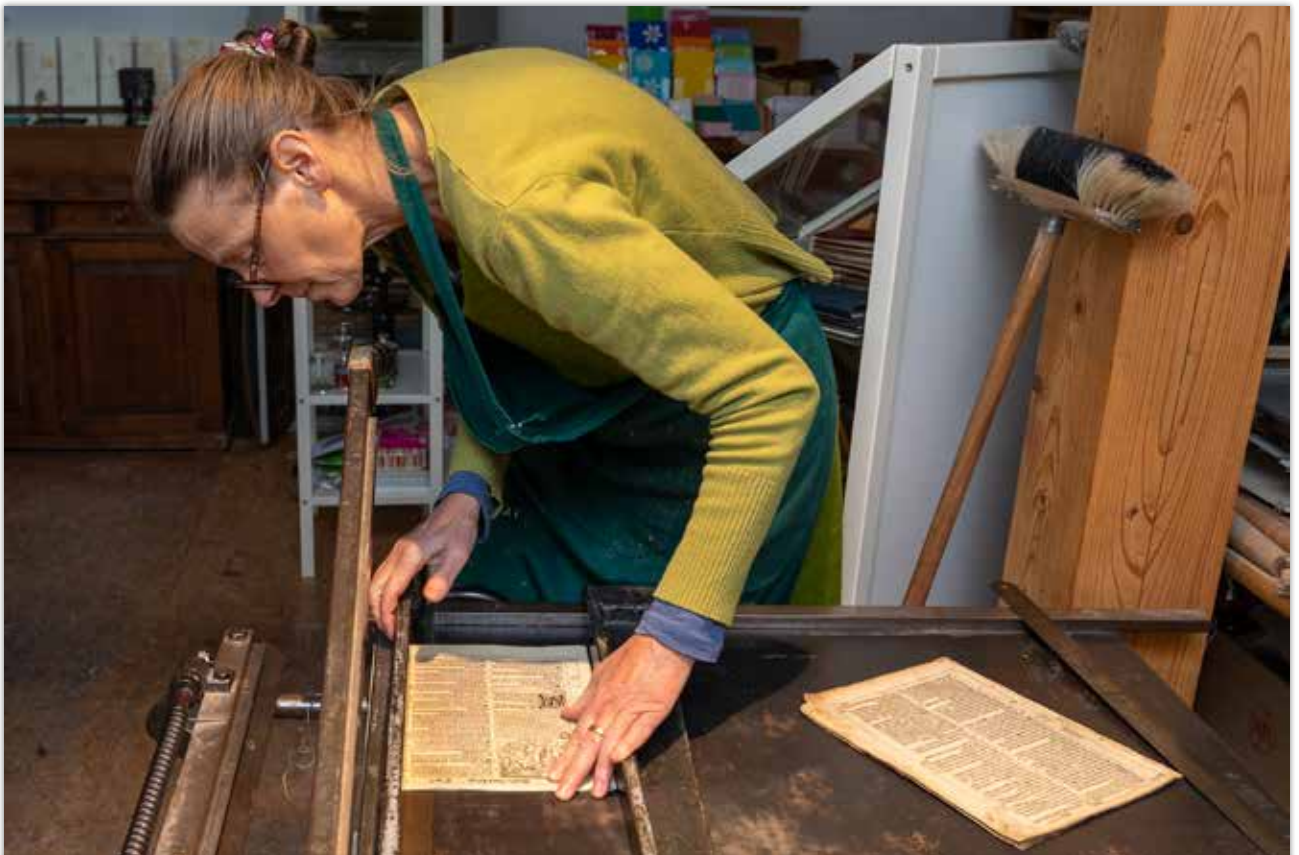
Beschneiden der ergänzten Lagen