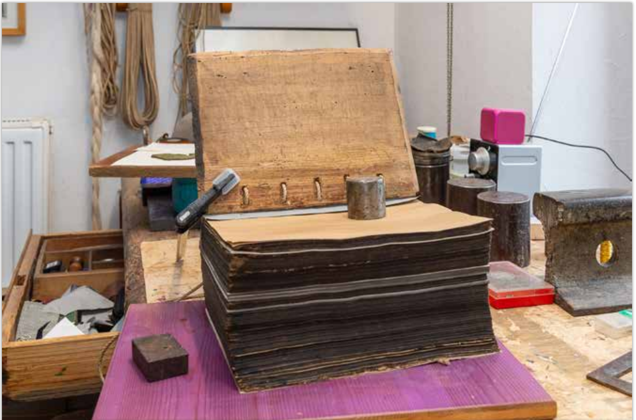
Fixieren der Holzverbindung