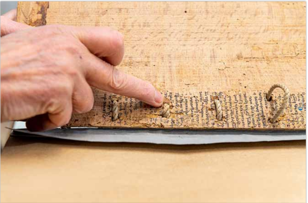
Verpflocken der Bünde im Buchdeckel