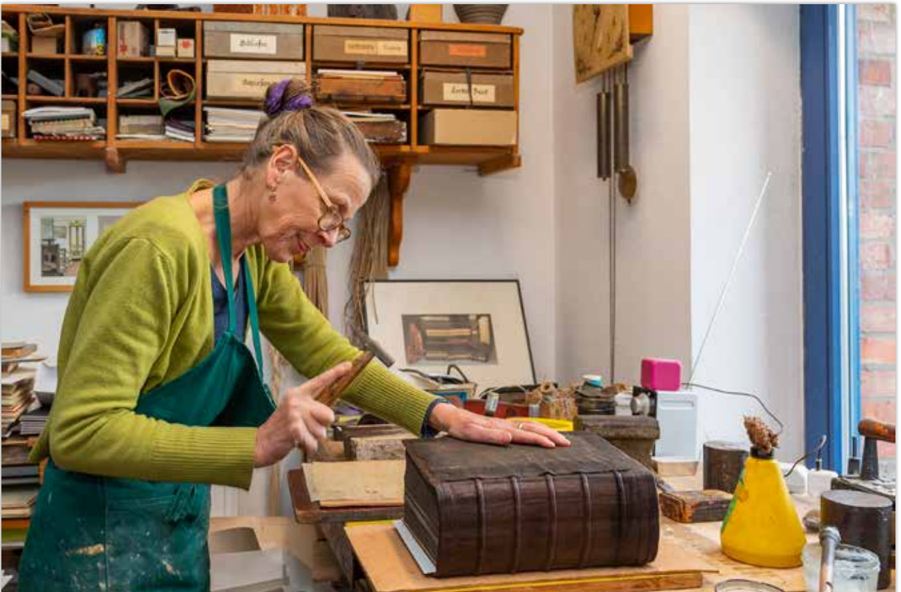
Aufarbeiten des alten Leders