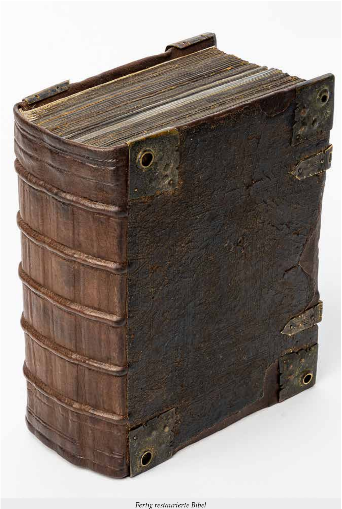
Fertig restaurierte Bibel