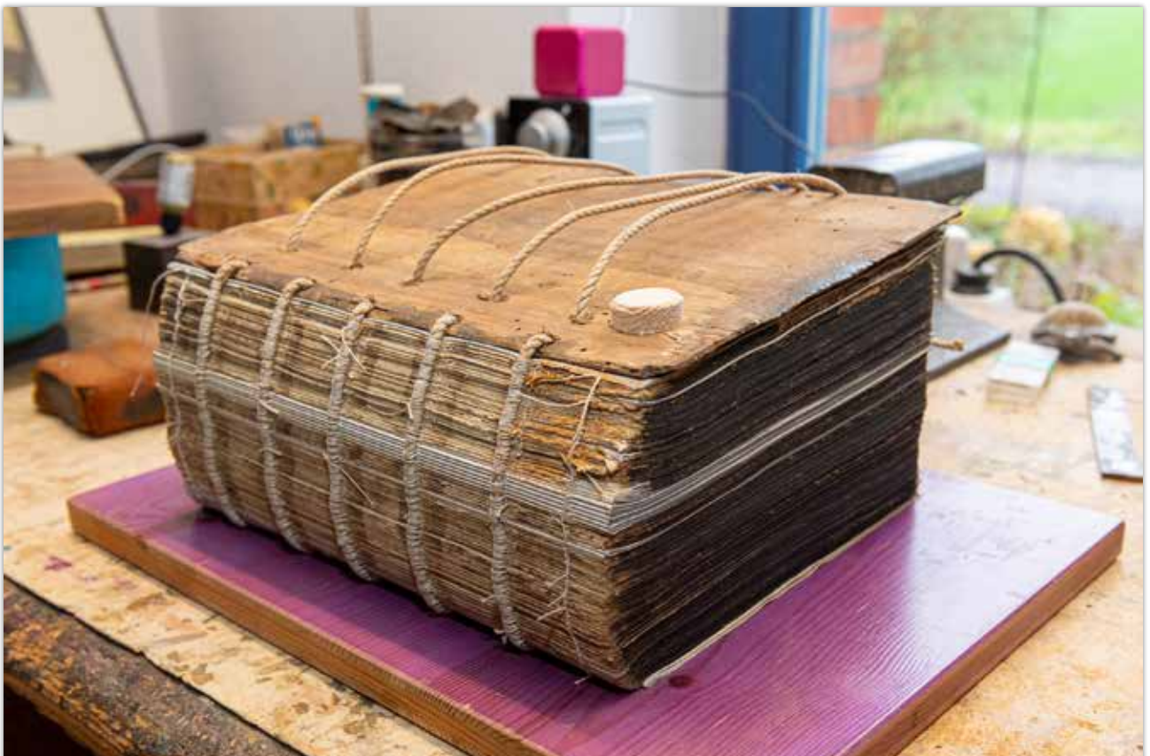
Holzverbindung zur Reparatur des gebrochenen Deckels