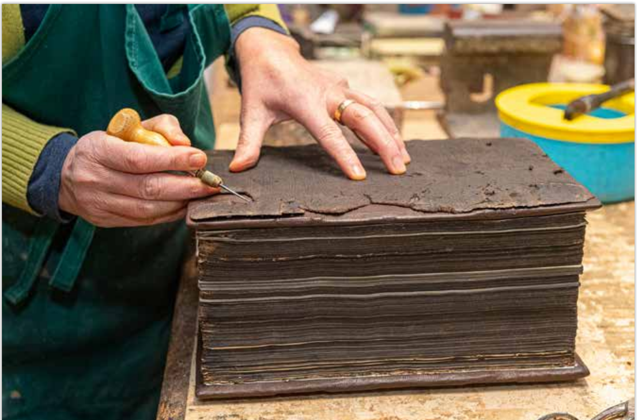
Anzeichnen des alten Ledernutzens