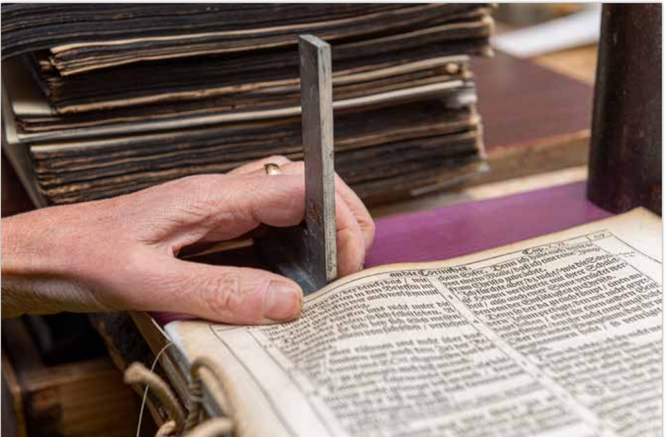
Ausrichten der Lagen