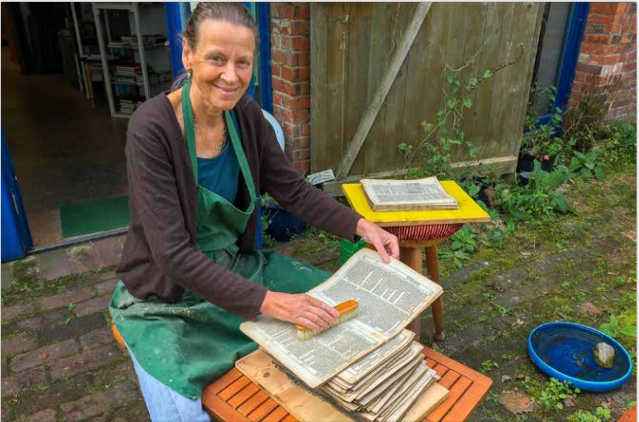
Zerlegen und Reinigen der Bibel