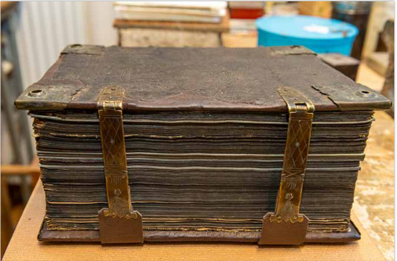
Fertige Bibel mit Schließen