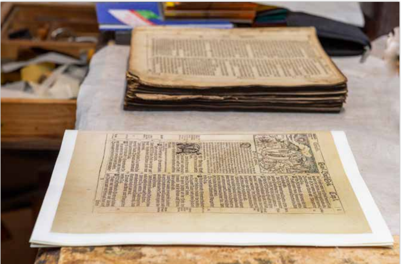
Ergänzen von fehlenden Lagen durch Kopien aus der Herzog August Bibliothek