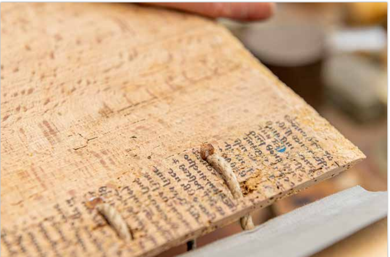
Verpflocken der Bünde im Buchdeckel