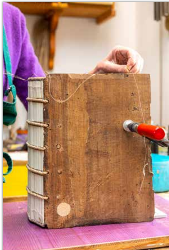
Buchblock mit angesetzten Deckeln