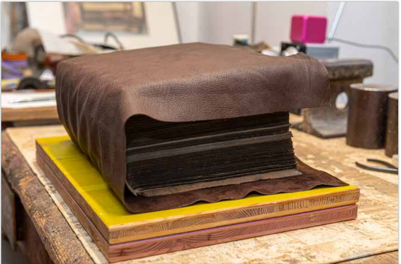
Neues Leder anpassen